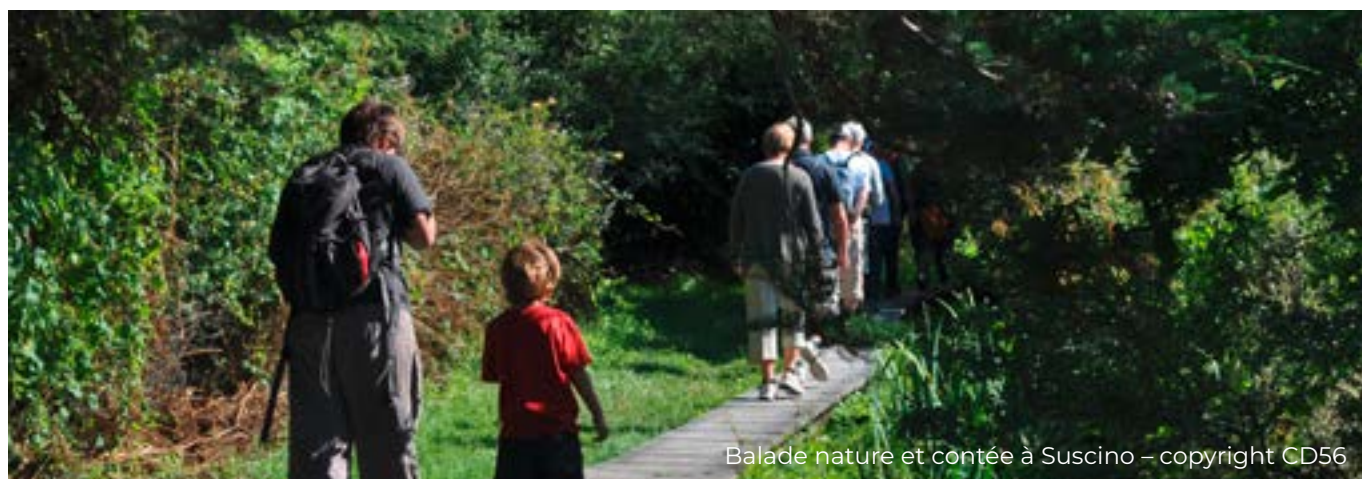
Balade nature et contée à Suscino

Tout le programme sur nature.morbihan.fr