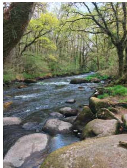
Cours d'eau de l'Ellé à Sainte-Barbe, Plouharnel - CD56

La mise en place d'une politique en faveur des espaces naturels sensibles est une compétence du Département, et l'éducation à l'environnement est au cœur de cette politique. Cette ambition a été renouvelée lors de la session de l'assemblée départementale du 22 décembre 2023 qui a adopté le nouveau schéma départemental des espaces naturels sensibles et de la biodiversité . Celui -ci fixe les objectifs et engagements pris par le département pour la période 2024 -2035 pour préserver le patrimoine naturel morbihannais et faciliter l'accès à la nature pour tous.